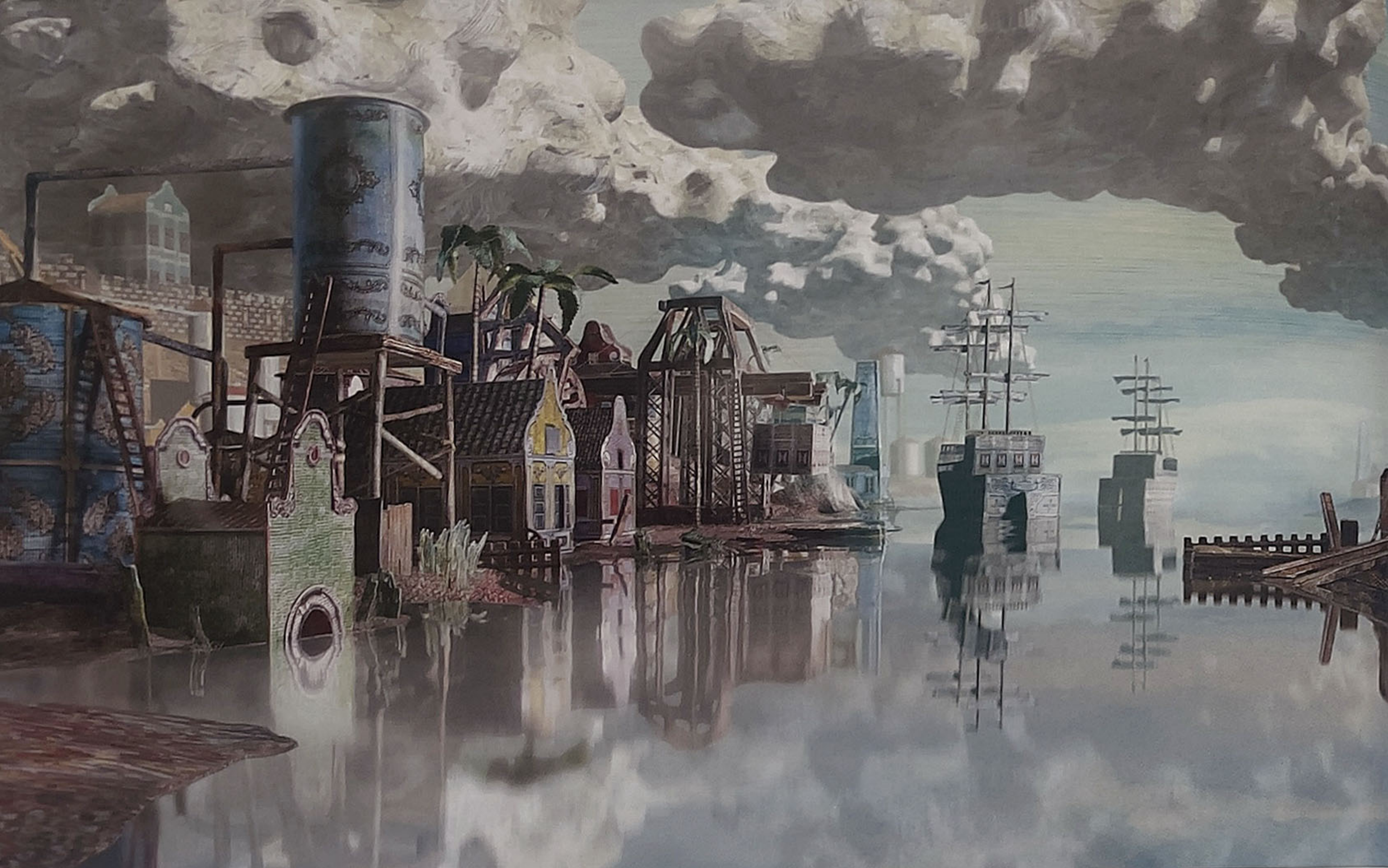
'The Admiral's Headache - Raffinaderij', 2020, c-print, 106 x 170 cm