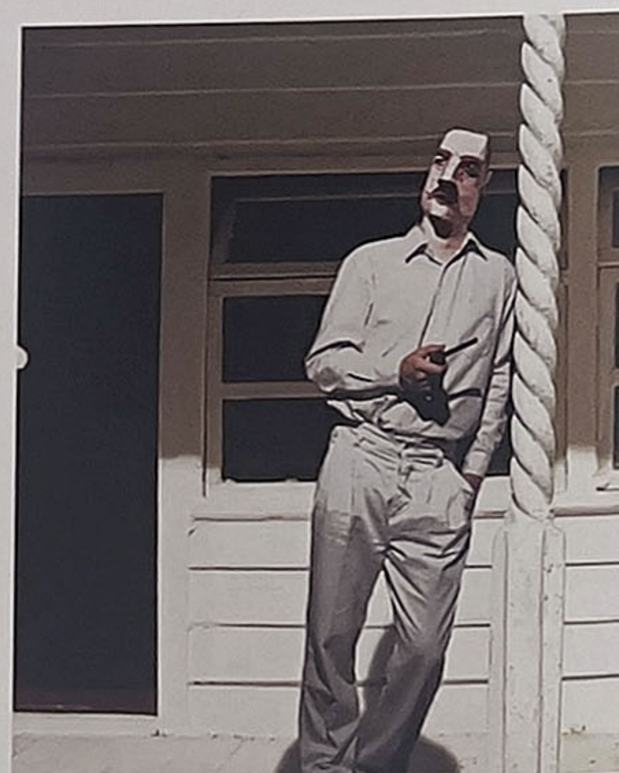
'Buitenpost #21', 2004, c-print, 40 x 30 cm

Niet altijd zijn zijn installaties en de foto’s daarvan zo realistisch. Bij het maken van de serie ‘Cahutchu’ (2006) merkte De Beijer dat er heel weinig documentatie was van wat hij wilde weergeven: de opkomst, bloei en ondergang van de rubberindustrie in Brazilië. Dat land was oorspronkelijk de enige plek op aarde waar de heveboom groeide, de boom waaruit, nadat er een inkeping is gemaakt, het melkachtige